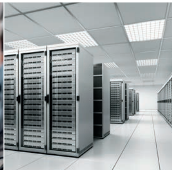
Industrieanlagen und Rechenzentren