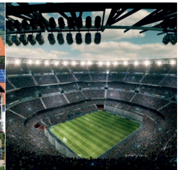
Vermietung von Stromversorgungstechnik