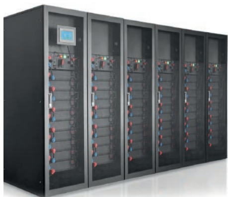
Lithiumbatterie-Sicherheitsschrank von Riello