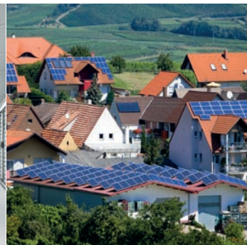
LEC Zusammenschluss lokaler Energiegemeinschaften