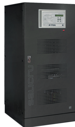
SLC X-TRA 100 kVA