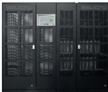
SLC X-TRA 600 kVA