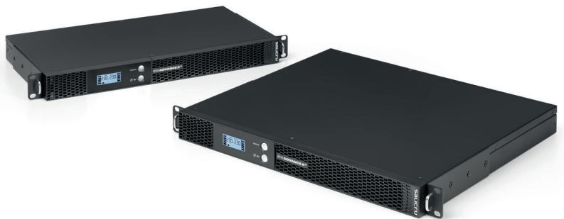
SPS ADVANCE R